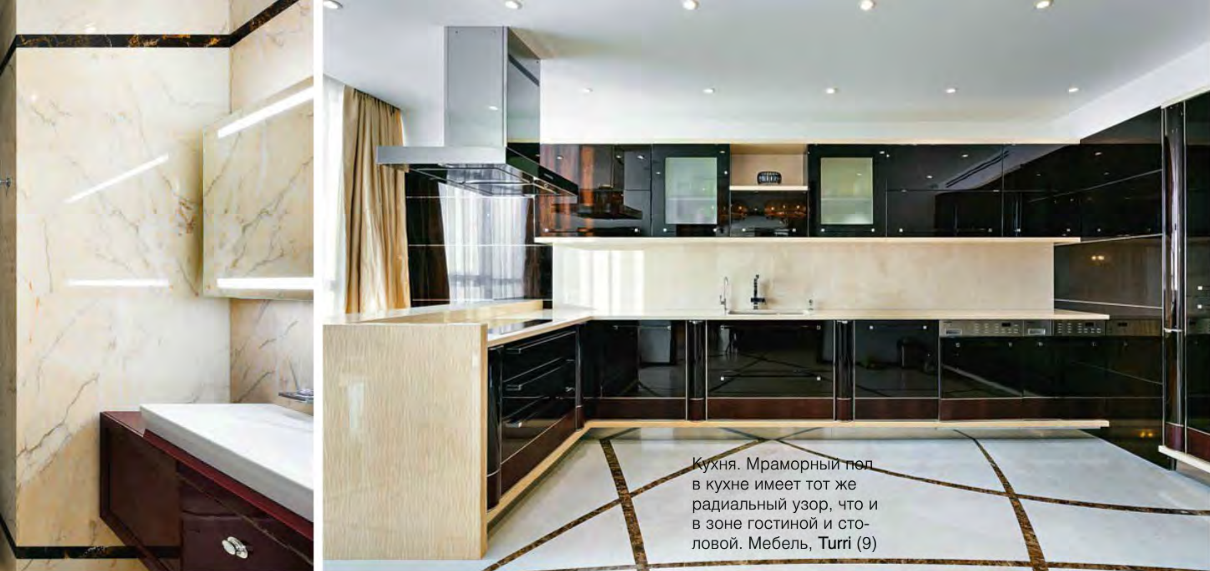
Кухня. Мраморный пол в кухне имеет тот же радиальный узор, что и в зоне гостиной и столовой. Мебель, Turri (9)