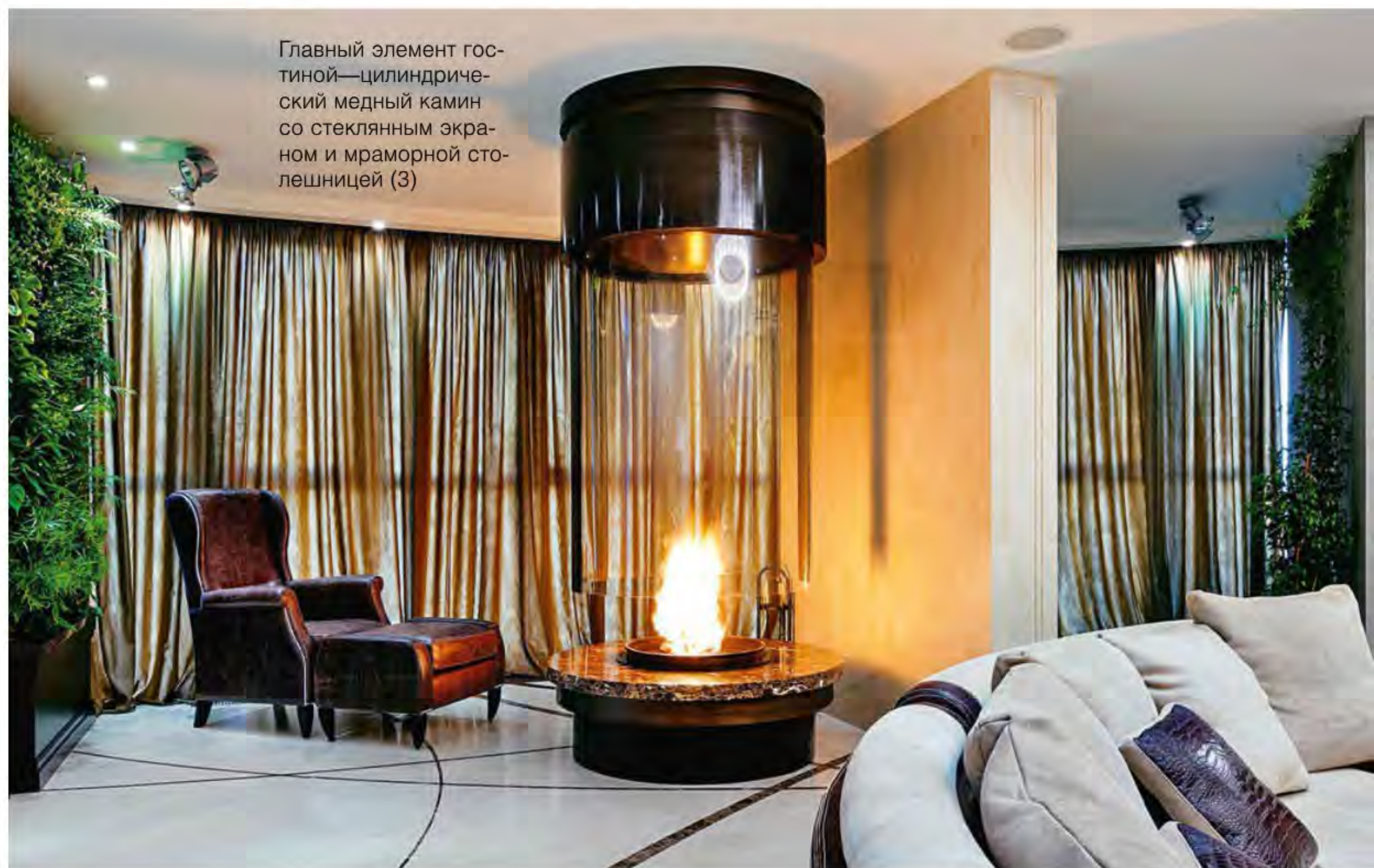
Главный элемент гостиной—цилиндрический медный камин со стеклянным экраном и мраморной столешницей (3)

Для этого интерьера архитекторы придумали медный камин со стеклянным экраном