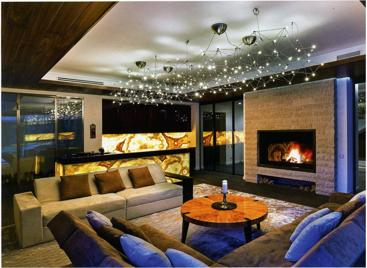
Комната отдыха возле бассейна