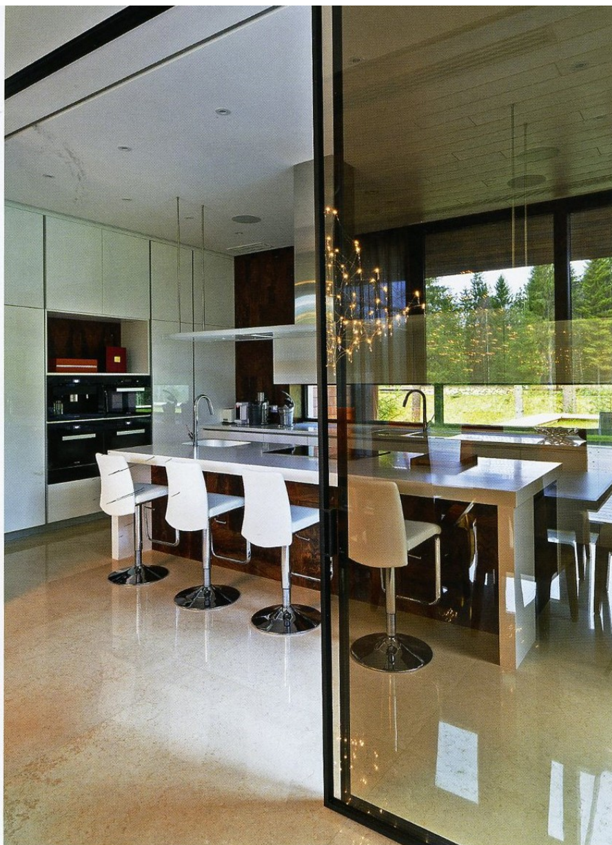
Кухонный остров можно использовать и как барную стойку

На площадке в полтора гектара заказчик – молодой бизнесмен с женой и ребёнком хотел иметь современный функциональный дом, рассчитанный на круглогодичное проживание и множество гостей, с максимальным остеклением и открытой планировкой. Немаловажным было то обстоятельство, что архитектура дома должна была соответствовать общей стилистической концепции посёлка, именно поэтому здесь появилась двускатная крыша, а вслед за ней и скрытая система водостоков. Водостоки размещены под обшивкой фасада. Это решение позволило сделать дом более минималистичным. При планировке был учтен, а точнее использован трехметровый перепад высот участка: архитекторы вписали в низинную часть цокольный этаж, увеличив тем самым метраж дома. В «подземном» этаже находятся спа и гараж. Частное про-