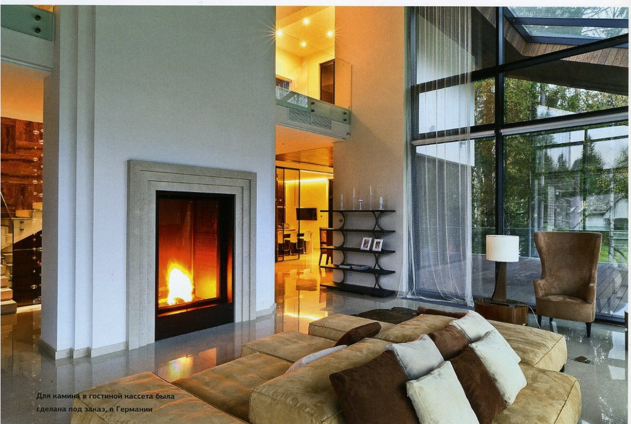
Для камин в гостиной нассета была сделана под заказ, в Германии