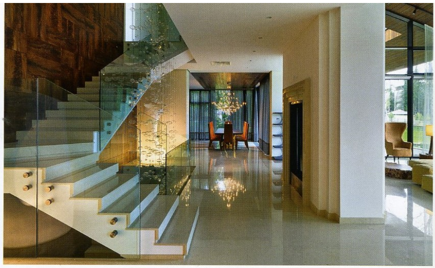
Около лестницы, соединяющей цокольный, первый и второй этажи, висит люстра от Leucos